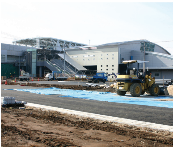
▲つくばEX沿線(守谷)の区画整理事業地

同市では組合施行の「守谷東(40ヘクタール)と市施行の「守谷駅周辺(39ヘクタール)」の区画整理が隣り合う形で進んでいる。現在分譲中の「守谷東」