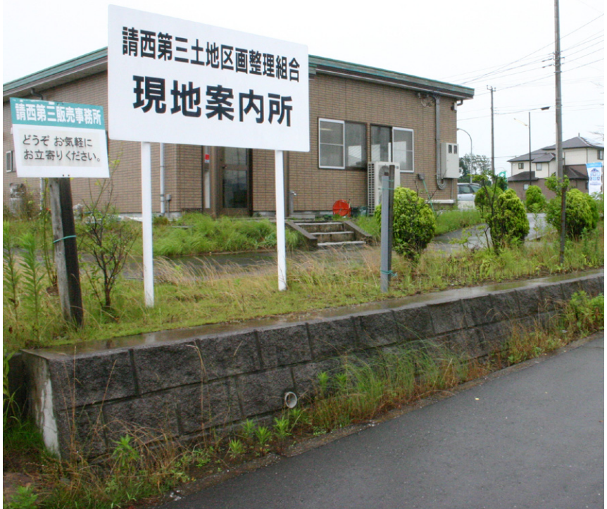
▲保留地が分譲されている木更津市の「請西第三」