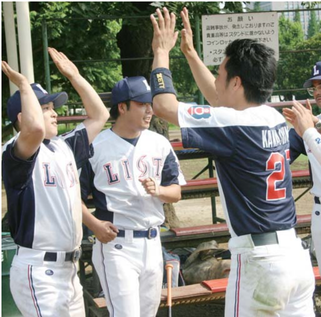
大逆転勝ちに沸くリストナイン