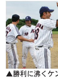
▲勝利に沸くケンコーポナイン

三井建設 0010200-010003X-43 リクルートコスモス本社(同開閉切)