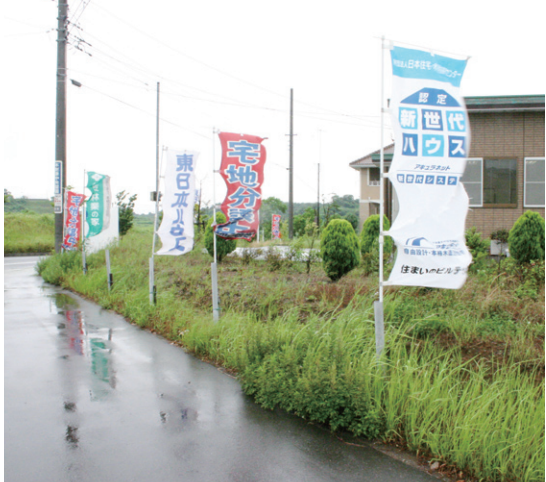
▲ハウスメーカーのノボリは沢山あるが...

別表は、木更津市で施行、千葉県下でも区画整理中の区画整理事業団地が、多く行われてきた地域だ。6団地合計で面積は約570ヘクタール、総事業費は約1632億円だ。同市では、多額借金も、組合による区画整理が積極的に区画整理を手がけてきたことあり、行中の4団地の総面積は、約304ヘクタールで、約56%、「中尾・伊豆島」が22%、「烏田」は31%、約22%の保留地処分が見込まれる。しかし、事業的には厳しいものばかりだ。工事契約で工事請負つて、ゼネコンが買い取り保証しているものも、多いのも特徴で、現在保留地の処分状況は芳しくない。事業完了が近い。