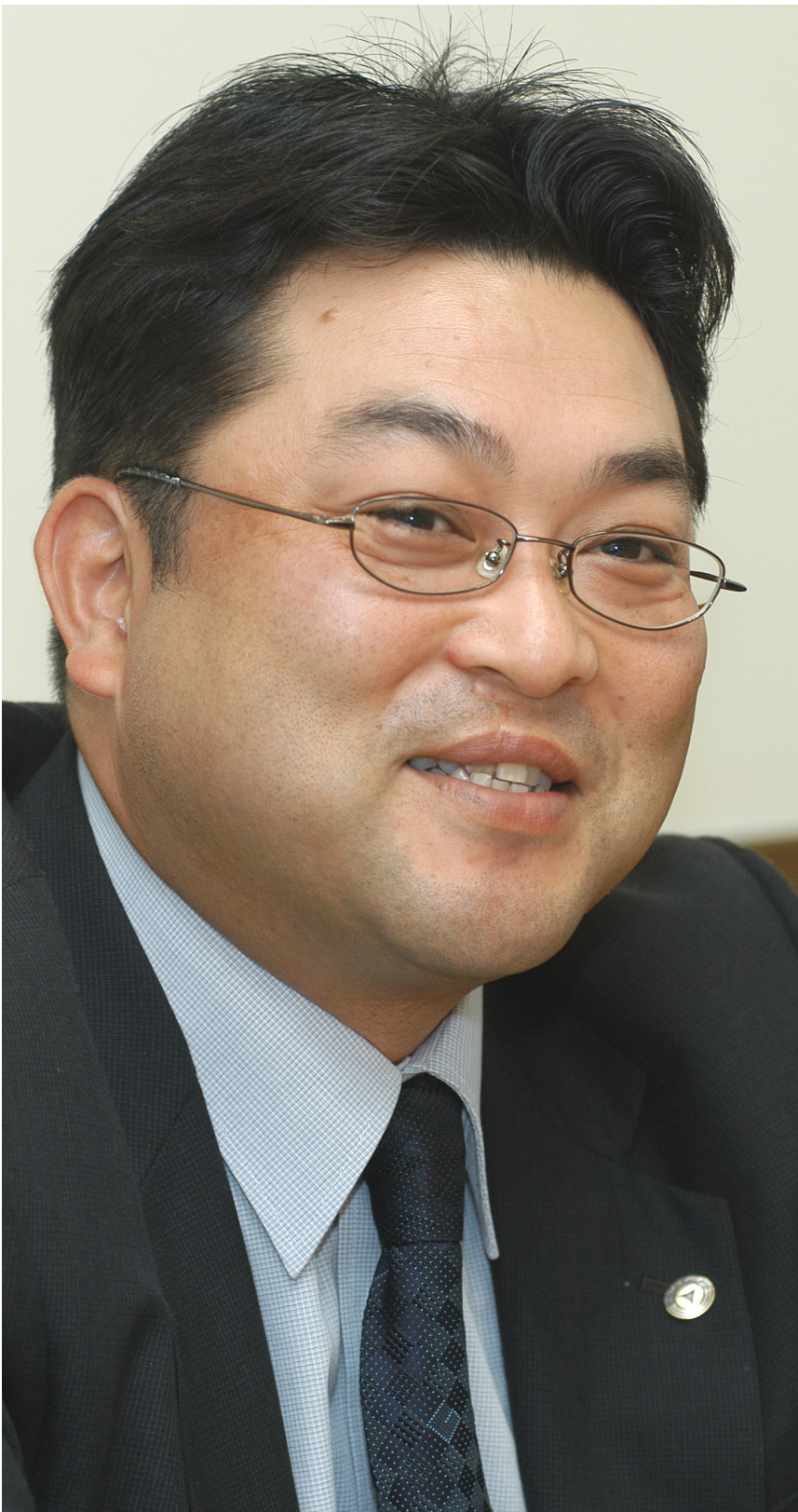
▲「勝ったら『みんなのおかげ』と、お立ち台でしゃべろうと考えていました」

この年の春の甲子園大会で、帝京は初戦で池田と対決。0-11で敗れている。「僕がくじを引いてしまったんです。観客が5万人入りました。あつという間に終わって